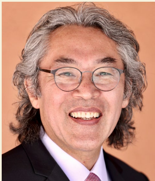
〈사진: 이경식 수석 부총장(국제협력)〉