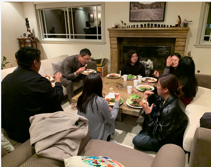
〈사진: 바쁜 한 해 끝에서, 함께 먹고 이야기하며 잠시 쉬어갈 수 있었던 따뜻한 연말의 시간〉