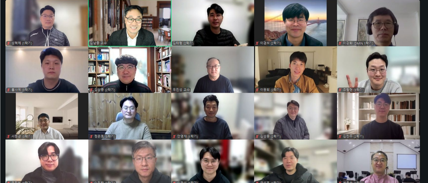
〈사진: 2025년 실천신학 목회학 박사(D.Min.) 집중 수업 중〉

클레어몬트 신학대학원(Claremont School of Theology, CST)의 실천신학 목회학 박사(D.Min.) 한국어 과정 집중 수업이 2026년 1월, 대전 목원대학교에서 열린다. 한국어로 진행되는 이 집중 수업은 글로벌 신학 교육과 지역 목회 현실을 연결해 온 CST D.Min. 프로그램의 교육 철학을 현장에서 깊이 경험할 수 있는 자리로 기대를 모은다.